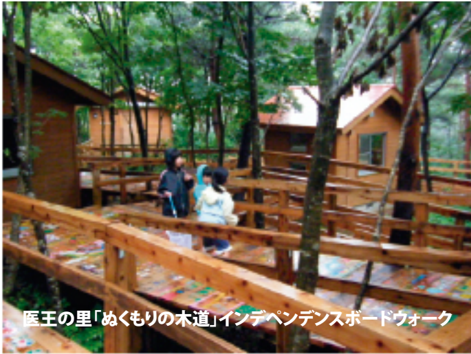
医王の里「めくもりの木道」インデペンデンスボードウォーク